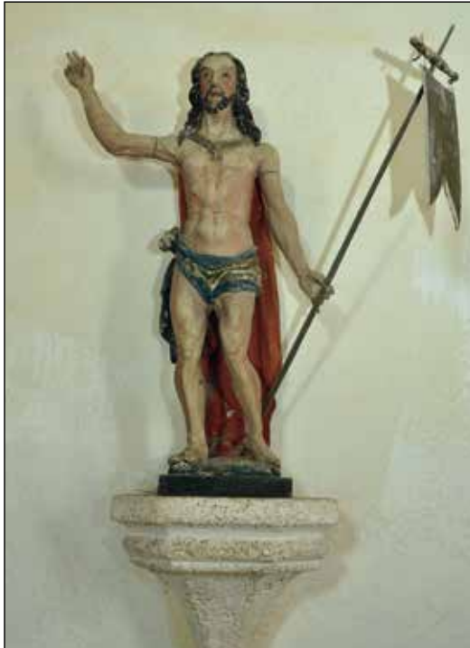
Kirche Dörnthal: „Der Auferstandene mit der Siegesfahne“